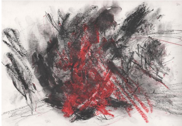
Helga Weule · Prozessbild 3 Krise