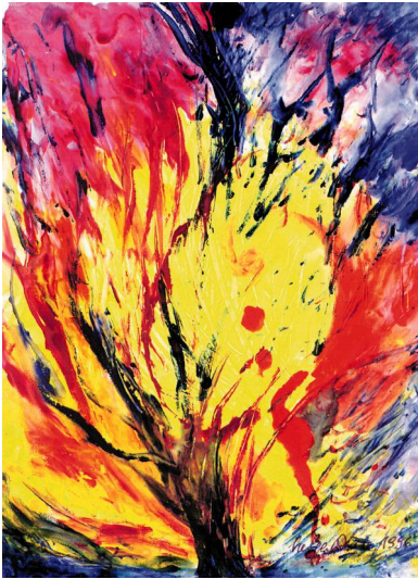
Helga Weule · Feuerbaum 1997