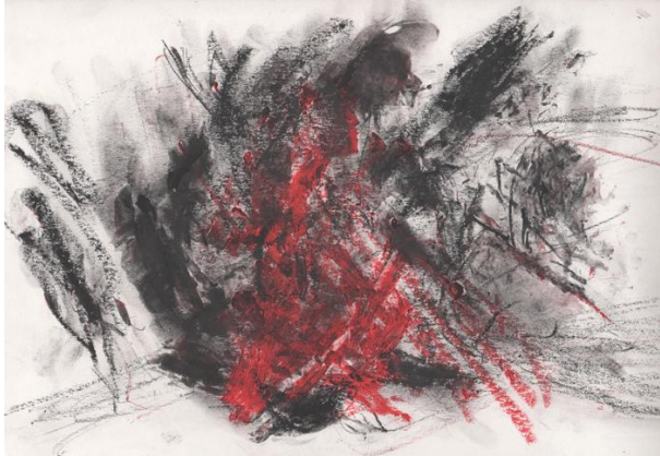
Helga Weule · Prozessbild 3 Krise