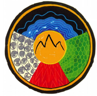
Medizinrad der Dagara

Die Faszination aller Formen von Aufstellungsarbeit liegt in ihrer emotionalen Wirkung auf die Beteiligten und im Schöpfen aus einem unbekanntem Wissen im Raum der Aufstellung. Auftauchen von Gefühlen und