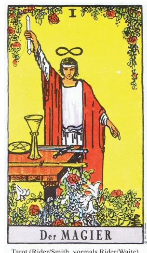
Tarot (Rider/Smith, vormals Rider/Waite)