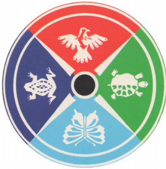
Medizinrad Bear tribe (Sun Bear)