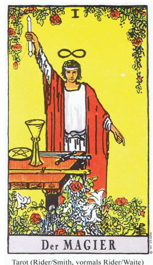
Tarot (Rider/Smith, vormals Rider/Waite)